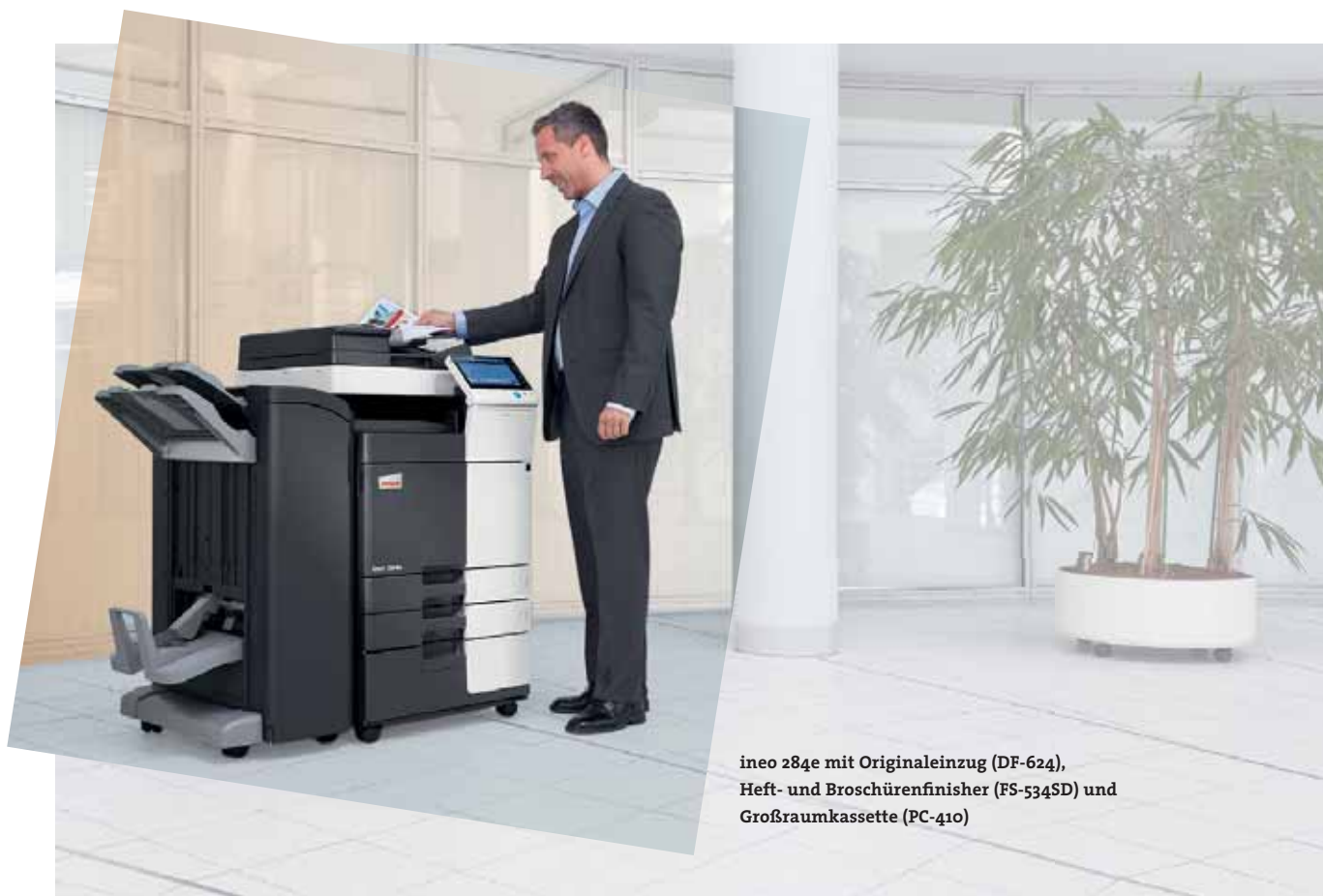
ineo 284e mit Originaleinzug (DF-624), Heft- und Broschürenfinisher (FS-534SD) und Großraumkassette (PC-410)

Zahlreiche Energiesparmaßnahmen sorgen bei den ineo Schwarzweißsystemen dafür, dass der Energieverbrauch um bis zu 40 Prozent unter denen der Vorgängermodelle liegt. Das spart zum einen Geld, hilft aber auch der Umwelt. Die neue ineo e-Serie ist nicht nur gut für das Unternehmen, sondern verbessert auch dessen ökologischen Fußabdruck.