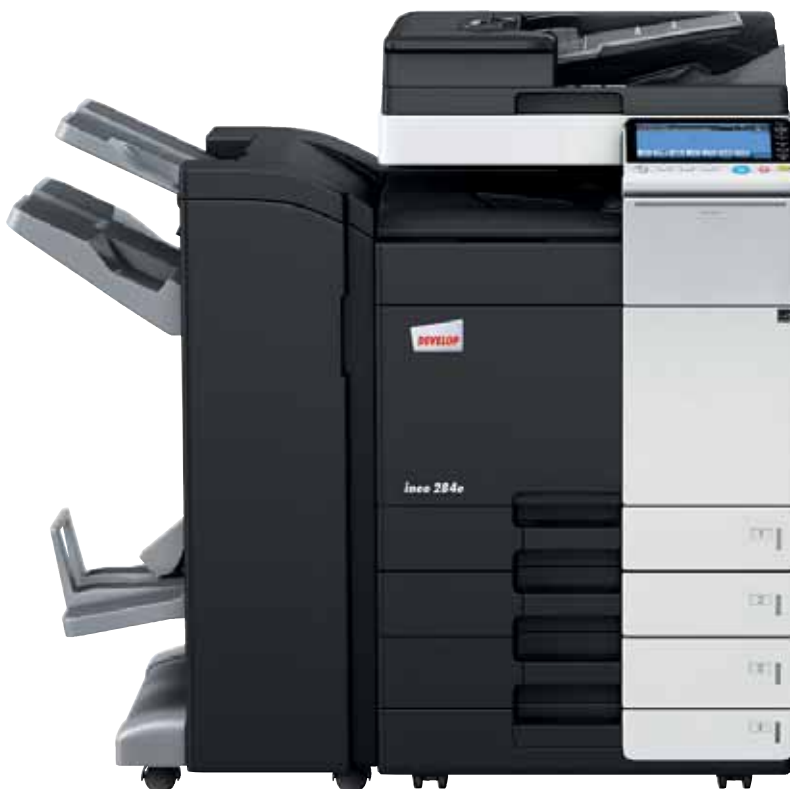
ineo 284e mit Dual Scan Originaleinzug (DF-701), Heft- und Broschürenfinisher (FS-534SD) und Papierkassette (PC-210)

Jedes dieser Multifunktionssysteme – ineo 224e, ineo 284e, ineo 364e, ineo 454e und ineo 554e – ist einfach zu bedienen und hat eine große Bandbreite zusätzlicher Funktionen, die die tägliche Arbeit im Büro entscheidend erleichtern. Wenn beim Drucken, Kopieren und Scannen Zeit gespart wird, bleibt mehr Zeit für die eigentlichen Kernaufgaben – und das steigert die Produktivität im Büro.