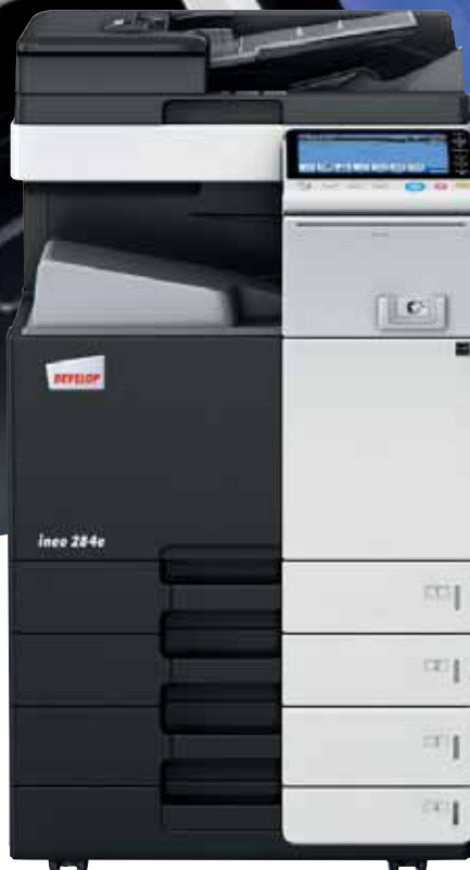
ineo 284e mit Dual Scan Originaleinzug (DF-701), Papierkassette (PC-210) und Ablagetisch (WT-506)