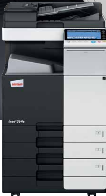
ineo+ 364e mit Papierkassette (PC-210) und Dual Scan Originaleinzug (DF-701),