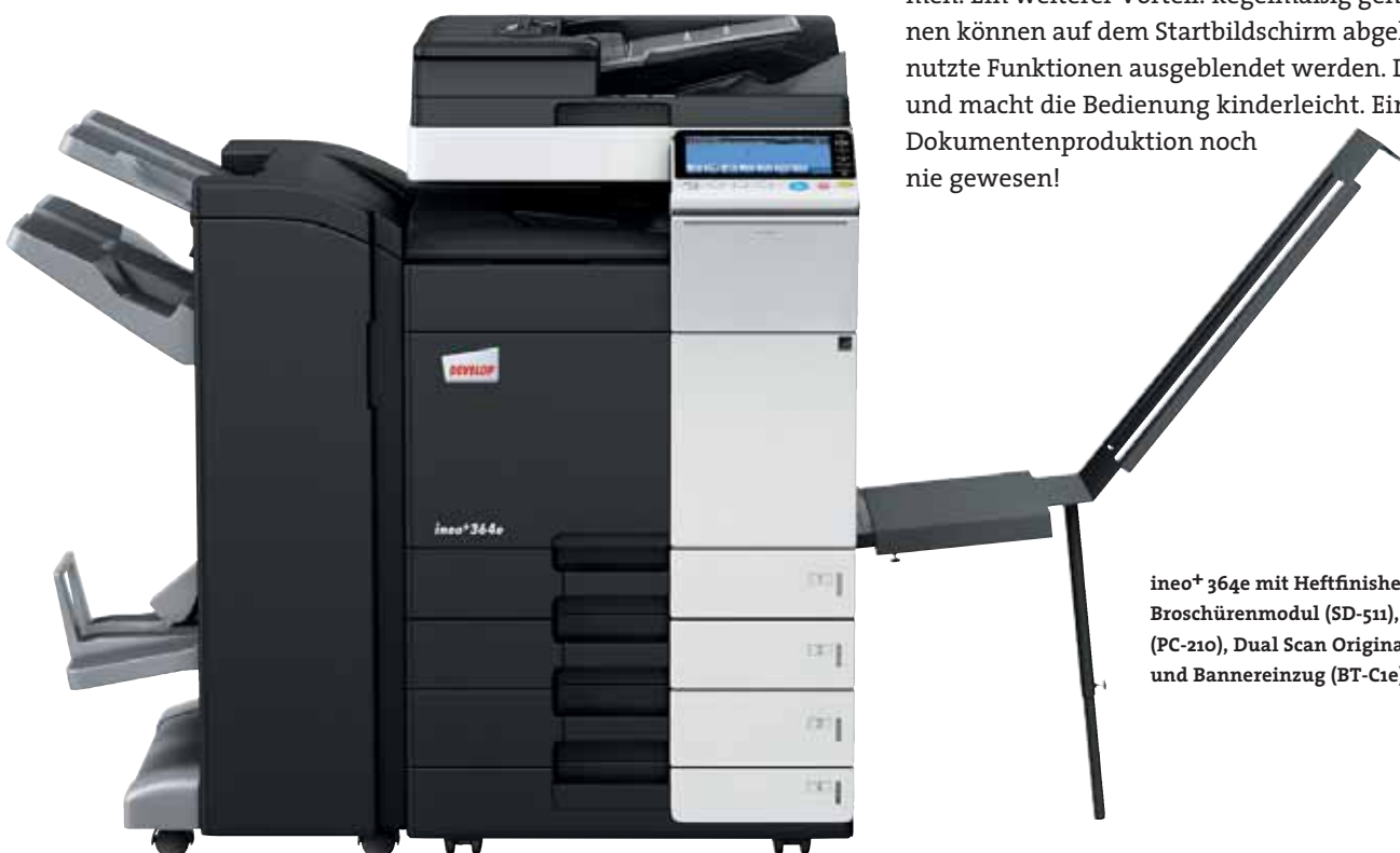
ineo+ 364e mit Heftfinisher (FS-534), Broschürenmodul (SD-511), Papierkassette (PC-210), Dual Scan Originaleinzug (DF-701) und Bannereinzug (BT-C1e)

Viele Multifunktionssysteme sind alles andere als anwenderfreundlich. Doch damit ist nun Schluss – die ineo+ 364e ist für Ihre Anforderungen wie geschaffen. Das Bedienungskonzept ist intuitiv erfassbar und genauso leicht verständlich wie das eines Smartphones oder Tablet-PCs. Der kapazitive 9 Zoll-Touchscreen verfügt über vertraute Funktionen wie flick, drag&drop und pinch in&out, sodass die Bedienbarkeit ganz einfach ist. Und dank der neuen Menüstruktur lassen sich alle Funktionen auf einen Blick erfassen und die gewünschten Einstellungen mit nur wenigen Berührungen vornehmen. Ein weiterer Vorteil: Regelmäßig genutzte Funktionen können auf dem Startbildschirm abgelegt, ungenutzte Funktionen ausgeblendet werden. Das spart Zeit und macht die Bedienung kinderleicht. Einfacher ist Dokumentenproduktion noch nie gewesen!