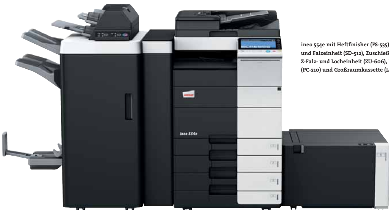
ineo 554e mit Heftfinisher (FS-535), Heft- und Falzeinheit (SD-512), Zuschießeinheit (PI-505), Z-Falz- und Locheinheit (ZU-606), Papierkassette (PC-210) und Großraumkassette (LU-204)

Jedes dieser Multifunktionssysteme – ineo 224e, ineo 284e, ineo 364e, ineo 454e und ineo 554e – ist einfach zu bedienen und hat eine große Bandbreite zusätzlicher Funktionen, die die tägliche Arbeit im Büro entscheidend erleichtern. Wenn beim Drucken, Kopieren und Scannen Zeit gespart wird, bleibt mehr Zeit für die eigentlichen Kernaufgaben – und das steigert die Produktivität im Büro.