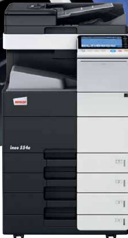
ineo 554e mit Papierkassette (PC-210), Ablagetisch (WT-506) und Ausgabefach (OT-506)