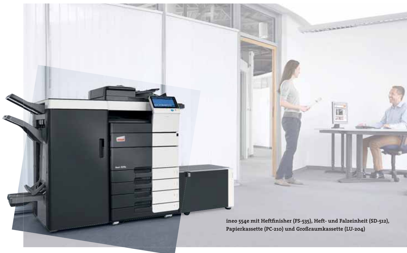
ineo 554e mit Heftfinisher (FS-535), Heft- und Falzeinheit (SD-512), Papierkassette (PC-210) und Großraumkassette (LU-204)

Zahlreiche Energiesparmaßnahmen sorgen bei den ineo Schwarzweißsystemen dafür, dass der Energieverbrauch um bis zu 40 Prozent unter denen der Vorgängermodelle liegt. Das spart zum einen Geld, hilft aber auch der Umwelt. Die neue ineo e-Serie ist nicht nur gut für das Unternehmen, sondern verbessert auch dessen ökologischen Fußabdruck.