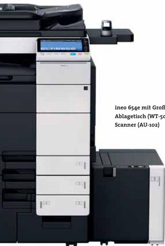
ineo 654e mit Großraumkassette (LU-301), Ablagetisch (WT-506) und Finger-Venen-Scanner (AU-102)

Welche Gründe gibt es, sich für eine ineo 654e zu entscheiden? Dieses hochwertige Schwarzweißsystem wird alle Scan-, Druck- und Fotokopierprozesse beschleunigen und erlaubt es Ihnen dadurch, sich voll und ganz auf Ihren Job zu konzentrieren. Natürlich geben viele Bürosysteme vor, schnell und produktiv zu sein. Diese Argumente allein reichen nicht aus, um in ein neues Drucksystem zu investieren. Mindestens genauso wichtig ist, was vor und nach dem Druckauftrag passiert, um die Workflows insgesamt zu verbessern – genau hier kann die ineo 654e punkten. Und das gleich mehrfach.