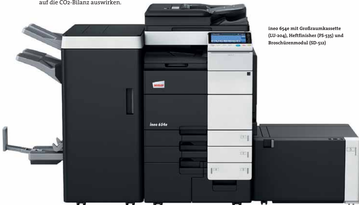
ineo 654e mit Großraumkassette (LU-204), Heftfinisher (FS-535) und Broschürenmodul (SD-512)

Viren, Trojaner, Hacker-Angriffe: Heutzutage kann kein Unternehmen es sich leisten, die wachsenden Erfordernisse der IT-Sicherheit zu ignorieren. Daher ist die ineo 654e nach ISO 15408 EAL 3 zertifiziert, dem höchsten Sicherheitsstandard für Multifunktions-systeme. Außerdem gehören zahlreiche Funktionen zur Datensicherheit, wie beispielsweise die IPsec-Verschlüsselung, für eine sichere Kommunikation innerhalb Ihres Unternehmens, zur Standardausstattung. Dank serienmäßiger Festplattenverschlüsselung und effektiver Authentifizierungstechnologie ist es ausgeschlossen, dass vertrauliche Dokumente oder Datensätze in die falschen Hände geraten. Auf diese Weise schützt DEVELOP Ihre sensiblen Daten – heute und in Zukunft.